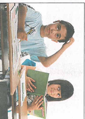
Deutsch lernen: Sprachkurs in den Ferien.